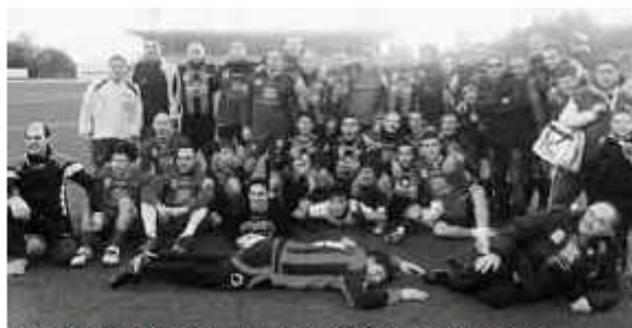
IL FOLTO GRUPPO DI PARTECIPANTI DEL MATCH ORGANIZZATA DAL FAN CLUB TROINA