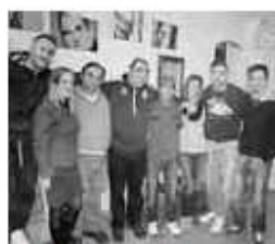
I VOLONTARI CON DUE OSPITI

Troina. Progetti di volontariato per giovani, persone diversamente abili e un «mini golf» per gli studenti